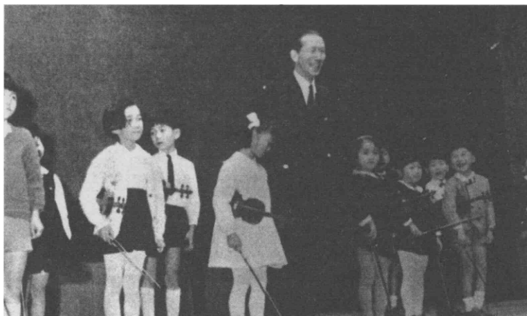
Доктор Судзуки со своими юными воспитанниками Доктор Судзуки и его жена Вальтрауд